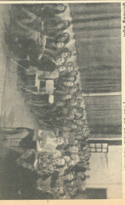
De zangavond, die vorige week in ons filmzaaltje werd gehouden, was een groot succes. Het aantal deelnemers was groot en de belangstelling voor de komende zangavond zal wel geweldig zijn.